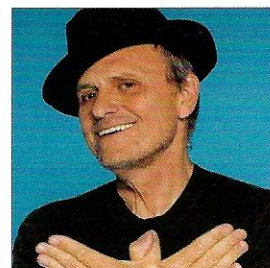
JEAN-CHARLES DE CASTELBAJAC EN HAUT DE L'AFFICHE

Un million d'euros à gagner pour celui ou celle qui trouvera la solution pour réduire nos déchets : c'est le défi green lancé par Éric Philippon, à travers sa fondation Famae, dont le but est de "faire pousser des bonnes idées pour la planète". Plus de 1 500 projets ont germé dans le monde entier pour répondre à ce concours hors norme et 100 % développement durable. À l'issue de sélections très serrées, trois projets d'avenir ont remporté le prix Famae lors d'une finale qui s'est déroulée le 26 mai, à VivaTech autour d'un jury prestigieux. Le gagnant ? L'inventeur de la première couche pour bébé 100 % biodégradable. On applaudit et on continue ! Éric Philippon, financier au grand cœur, ne souhaite pas s'arrêter là : après les déchets, l'eau sera l'enjeu du concours Famae 2019. https://famae.earth