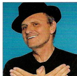
JEAN-CHARLES DE CASTELBAJAC EN HAUT DE L'AFFICHE

Un million d'euros à gagner pour celui ou celle qui trouvera la solution pour réduire nos déchets : c'est le défi green lancé par Éric Philippon, à travers sa fondation Famae, dont le but est de "faire pousser des bonnes idées pour la planète". Plus de 1 500 projets ont germé dans le monde entier pour répondre à ce concours hors norme et 100 % développement durable. À l'issue de sélections très serrées, trois projets d'avenir ont remporté le prix Famae lors d'une finale qui s'est déroulée le 26 mai, à VivaTech autour d'un jury prestigieux. Le gagnant ? L'inventeur de la première couche pour bébé 100 % biodégradable. On applaudit et on continue ! Éric Philippon, financier au grand cœur, ne souhaite pas s'arrêter là : après les déchets, l'eau sera l'enjeu du concours Famae 2019. https://famae.earth