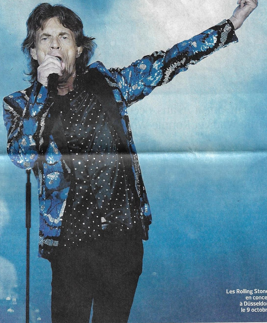
Les Rolling Stones en concert à Düsseldorf, le 9 octobre.

À Paris pour trois concerts, le groupe anglais inaugure l'U Arena, nouvelle salle de l'Ouest parisien à Nanterre. Depuis 2012, les quatre rockeurs ne quittent pas la scène. PAGE 30